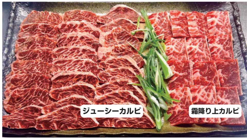
ジューシーカルビ