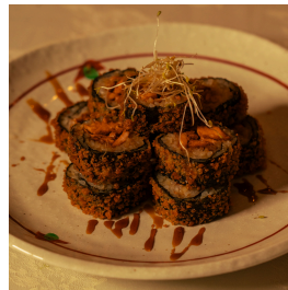
Golden salmon maki جولدن سلمون مكي

Panko deep-fried maki filled with cooked salmon, mayonnaise, and teriyaki sauce