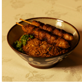
Yaki tori fried rice ياكي توري فرايد رايس

Japanese rice, vegetables, grilled chicken, topped with spring onions رز ياباني، خضار، دجاج مشوي، و بصل اخضر 5.200