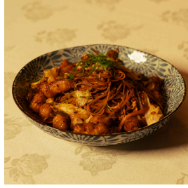
Shack noodles شاك نودلز

Thin noodles, mixed vegetables, fried garlic, your choice of meat نودلز رقيقة، خضروات مشكلة، ثوم مقلي، اختيارك من اللحوم Chicken 5.100 Shrimp 5.300 Mixed (shrimp and chicken) 5.100