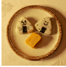
Happy Onigiri هاي اونيچيري

Rice triangles (Onigiri) filled with cooked salmon, served with tamago-style egg مثلثات أرز (أونيچيري) محشوة بالسلمون، تُقدَّم مع بيض تاماجو على الطريقة اليابانية 4.200