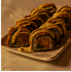
Golden fried جولدن فرايد

Panko deep-fried maki, shrimp tempura, cucumber, avocado, spring onions, topped with mayonnaise, and eel sauce ماكي مقلي بپانكو، تيمبورا الروبيان، خيار افوكادو، بصل اخضر، مايونيز، صلصة ايل 5.300