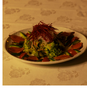
Tataki salad سلطة تاتاكي

Mixed salad leaves, cucumber, cherry tomatoes, red and white radish, tuna, tataki sauce, and beetroot.