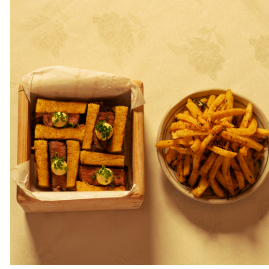
Wagyu sando واغيو ساندو

Brioche bread, Wagyu beef, truffle sauce, served with Japanese-style fries on the side خبز بريوش، لحم واغيو، صلصة الكمأة، بطاطس جانبية على الطريقة اليابانية 8.000