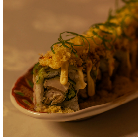
Veggie special dragon فيجي سبيشال دراجون

Fried tofu, cucumber, topped with avocado, mayonnaise, tempura flakes, eel sauce, spring onions توفو مقلي، خيار، أفوكادو، مايونيز، رقائق التيمبورا، صلصة إيل، بصل أخضر 4.800