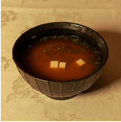
Miso soup ميسو سوب

Tofu, miso paste, dry wakame, spring onion توفو، معجون الميسو، واكامي مجفف، بصل أخضر