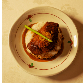
Salmon Teriyaki سلمون تيرياكي

Japanese rice, salmon fillet, teriyaki sauce, asparagus رز ياباني، فيليه السلمون ، صلصة تيرياكي، هليون 8.000