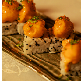
Dynamite shrimp roll داينمايت شريمب رول

Avocado, cucumber, black sesame seeds, topped with popcorn shrimp tossed in dynamite sauce, togarashi