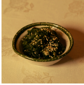
Wakame salad سلطة الأعشاب البحرية واكامي