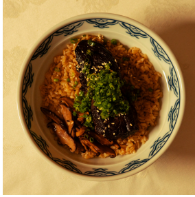
Short rib donburi شورت ريب دونبوري

Japanese rice,slowcooked beef short ribs,shiitake mushrooms, white sesame, spring onions رز ياباني، شورت ريب مطهو ببطء مشروم شيتاكي، سمسم أبيض، بصل، أخضر 10.500