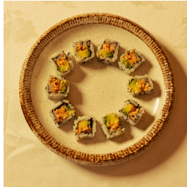
Mini salmon maki ميني سلمون ماکي

Mini maki (10 pieces) with Cooked salmon, cucumber, avocado, black sesame seeds ميني ماکي 10 قطع، سلمون مطبوخ، خيار، أفوكادو، سمسم اسود 4.000