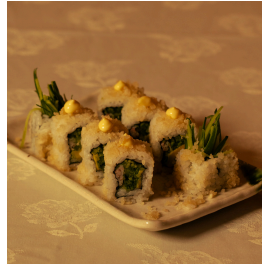
Crispy California كريسي كاليفورنيا

Crab sticks, cucumber, avocado, tempura flakes, mayonnaise اعواد السلطعون، خيار، افوكادو، رقائق التيمبورا، مايونيز 5.400