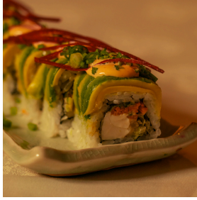
Green foreset جرين فوريسٽ

Asparagus, cucumber, takuan, carrot, lettuce, special sauce, topped with avocado, fried tempura tofu spring onions, and beetroot هليون، خيار، تاكوان، جزر، خس، صلصة خاصة، أفوكادو، توفو تيمبورا مقلي، بصل أخضر، وشمندر 4.800