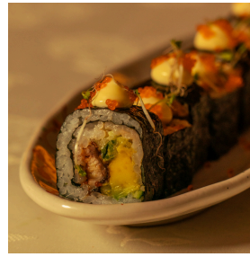
Unagi Hosomaki اوناجي هوسوماكي

Eel fish, asparagus, avocado, cucumber, spring onions, eel sauce, topped with mayonnaise, tobiko سمك الابل، هليون، افوكادو، خيار، بصل اخضر ، صلصة ايل، مايونيز، توبيكو 6.000