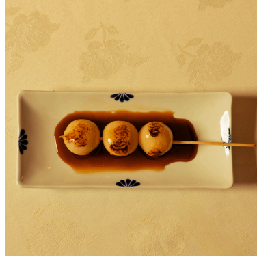
Mitarashi dango ميتاراشي دانجو

Grilled sticky rice balls coated with a sweet and savory sauce كرات أرز لزجة مشوية مغطاة بصلصة حلوة ومالحة 2.500