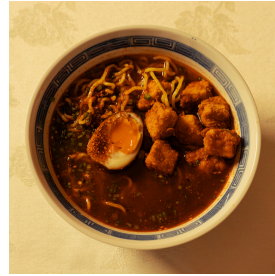
Ebi Ten Udon إيبي تن اودون

Udon noodles in a light broth, shrimp tempura, bok choy, and ajitama egg نودلز اودون في مرق خفيف ، روبيان تيمبورا ، بوك تشوي، وبيض أجيताما 6.500