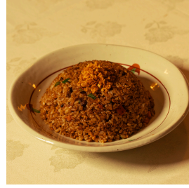
Beef fried rice بيف فرايد رايس

Japanese rice, beef, vegetables, egg, topped with fried garlic رز ياباني، لحم، خضار، بيضة، ثوم مقلي 5.000