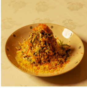
Kani salad سلطة كاني

Crab sticks, cucumber, carrot, cabbage, lettuce, kani sauce, tempura flakes, black sesame seeds, tobiko.