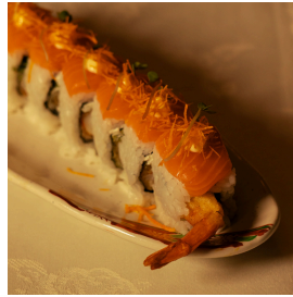
Cheesy salmon تشيزي سلمون

Shrimp tempura, cucumber, cream cheese, topped with salmon, mayonnaise and sweet potato chips تيمبورا الروبيان، خيار، جبنة، سلمون مايونيز ورقائق البطاطس الحلوة 6.000