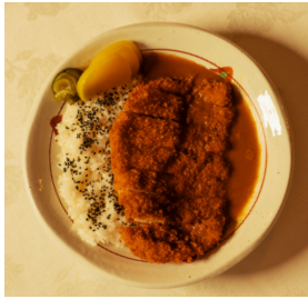
Chicken katsu curry تشكن كاتسو كاري

Steamed Japanese rice, fried Chicken breast, Japanese curry sauce, spring onion رز ياباني، صدر دجاج مقلي، صلصة الكاري اليابانية، بصل اخضر 6.000