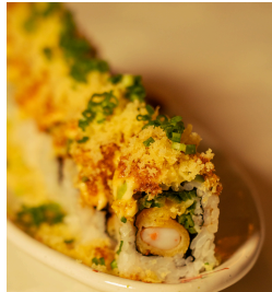
Special dragon سبيشال دراجون

Shrimp tempura, crab, cucumber, topped with avocado, mayonnaise, eel sauce, tempura flakes, and spring onions تيمبورا الروبيان، سلطعون، خيار، افوكادو، مايونيز، صلصة ايل، رقائق التيمبورا، بصل اخضر 5.500