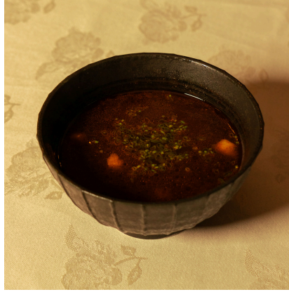
Spicy seafood soup سبايسي سي فود سوب

Mixed seafood with shrimp, scallops, and calamari in dashi broth مزيج من المأكولات البحرية يحتوي على روبيان، إسكالوب، وكاليماري في مرق داشي