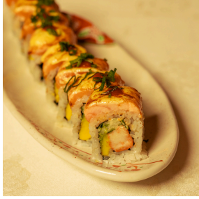
Salmon aburi maki سلمون ابوري مكي

Crab sticks, cucumber, avocado, topped with torched salmon, mayonnaise, chilisauce, spring onions سلمون محمر سلطعون، خيار، افوكادو، سلمون محمر باستخدام اللهب، مايونيز، صلصة حارة، بصل اخضر 6.000