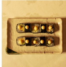
Mini tempura maki ميني تيمبورا ماکي

Mini maki (10 pieces) with shrimp tempura, cucumber, avocado, topped with mayonnaise ميني ماکي 10 قطع، تيمبورا الروبيان، خيار، أفوكادو، مايونيز 4.000