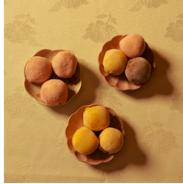
Mini Mochi ice cream ميني موتشي ايس كريم

Mini handmade mochi ice creams filled with flavorful ice cream.