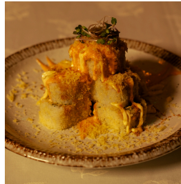
Crispy Ebi كريسي ايبي

Shrimp tempura, avocado spring onions, tempura flakes, eel sauce, dynamite sauce تيمبورا الروبيان، افوكادو، بصل اخضر، رقائق التيمبورا، صلصة ايل، صلصة الدايناميت 5.300