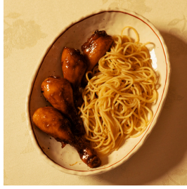
Chicken Drumsticks تشكن درام ستيكس

Chicken drumsticks covered with a sweetsavory sauce, served with spaghetti أرجل دجاج مغطاة بصوص حلو ومالح، تُقدَّم مع السباغيتي 4.500