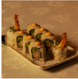
Classic tempura كلاسيك تيمبورا

Crab sticks, cucumber, avocado, tobiko, mayonnaise اعواد السلطعون، خيار، افوكادو، توبيكو، مايونيز 5.200