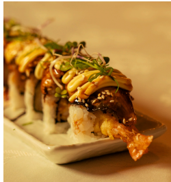
Special unagi سبيشال اوناجي

Shrimp tempura, crab sticks, avocado, tempura flakes, topped with eel, mayonnaise, eel sauce, white sesame seeds, spring onions