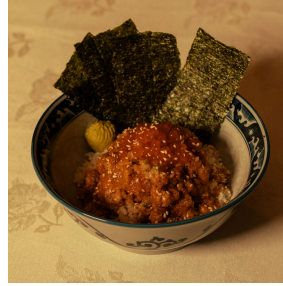
Tokyo seafood rice bowl طوكيو سي فود رايس بول

Finely chopped fish mix (tuna,hamachi,white fish, crab, shrimp) with Japanese rice , cucumber, spring onions, ikura, and served with nori sheets مزيج أسماك ناعمة مهروسة (تونة، هاماتشي، سمك أبيض، سلطعون، روبان) مع أرز ياباني، خيار، بصل أخضر، وإيكورا، يُقدّم مع شرائح نوري 9.500