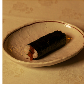
Tuna, nikiri sauce, chives تونة، صلصة نيكيري، ثوم معمر 3.500