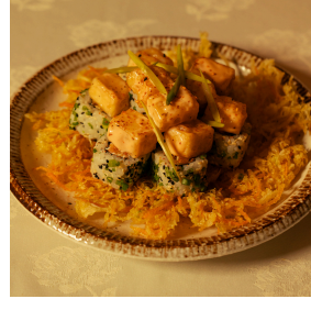
Age tofu roll اجي توفو رول

Carrot tempura, cabbage tempura, cream cheese, topped with fried tofu, tossed in a special sauce, togarashi, asparagus, served with cabbage and carrot tempura on the side تيمبورا الجزر، تيمبورا الملفوف، جبن كريمي، توفو مقلي مغطى بصلصة خاصة، توغاراشي، وهليون، يقدم مع تيمبورا الجزر والملفوف 5.000