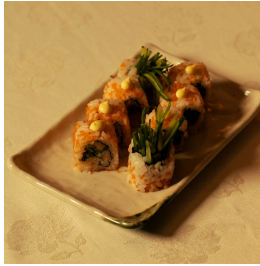
California maki كاليفورنيا مكي

Shrimp tempura, cucumber, avocado, tempura flakes, spicy mayo تيمبورا الروبيان، خيار، افوكادو، رقائق التيمبورا، صلصة سبايسي مايو 5.400