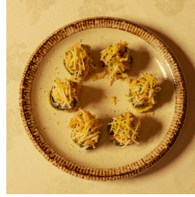
Million dreams مليون دريمز

Shrimp tempura, cucumber, topped with crab mix تيمبورا الروبيان، خيار، مشكل السلطعون 5.500