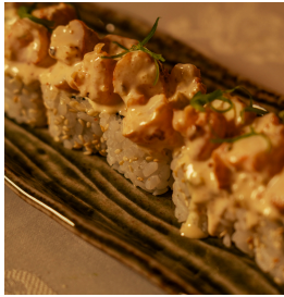
Grilled shrimp maki جريلد شريمب مكي

Cabbage, carrots, white sesame seeds, topped with grilled shrimp tossed in a special white sauce, and spring onions ملفوف، جزر، بذور سمسم أبيض، روبيان مشوي، صلصة خاصة، وبصل أخضر 5.300