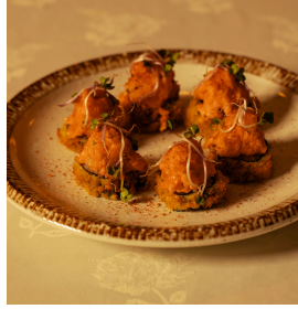
Crunchy salmon tartare كرنشي سلمون تارتار

Panko deep-fried maki, Avocado, cucumber, asparagus, topped with salmon tartare ماكي مقلي بپانكو، افوكادو، خيار، هليون، سلمون تارتار 6.300