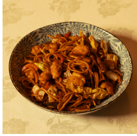
Yakisoba noodles ياكي سوبا نودلز

Classic Japanese noodle dish seasoned with sweet and savory sauce, mixed vegetables, your choice of meat نودلز ياباني كلاسيكي متبل بصلصة حلوة ومالحة، خضروات مشكلة، اختيارك من اللحوم Chicken 5.000 Shrimp 5.200 Mixed (shrimp and chicken) 5.000