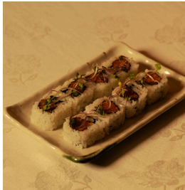
Spicy salmon maki سبايسي سلمون مكي

Smashed salmon mix, chili sauce, togarashi ،سلمون مهروس صلصة حارة، توغاراشي 5.500