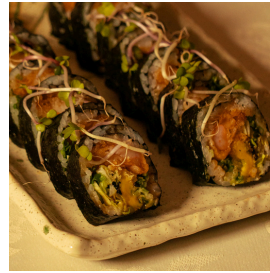
Dark ocean دارك اوشن

Thin pieces maki with shrimp tempura, crab, tempura flakes, spicy mayo, black sesame seeds, cucumber, avocado, lettuce, spring onions, eel sauce مكي مقطع إلى شرائح رفيعة، روبيان تمبورا، سلطعون، رقائق التيمبورا، صلصة سبائسي مايو، بذور سمسم سوداء، خيار، افوكادو، خس، بصل أخضر، صلصة ايل 5.500