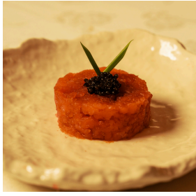
Tuna with tsukuri sauce and caviar, served with nori sheets تونة مع صلصة تسوكوري وكافيار، تُقدَّم مع شرائح نوربي 7.000