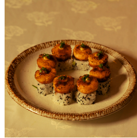
Yaki salmon maki ياكي سلمون مكي

Black sesame seeds, avocado, cucumber, topped with baked salmon, miso yuzu sauce, and spring onions